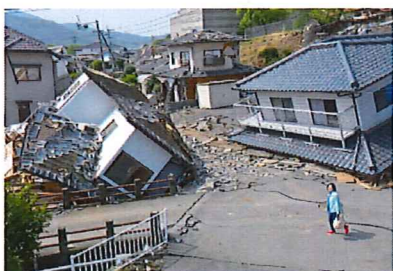
熊本地震(平成28年4月14日)