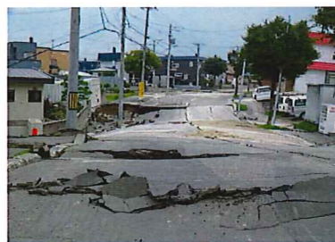
北海道胆振東部地震(平成30年9月6日)