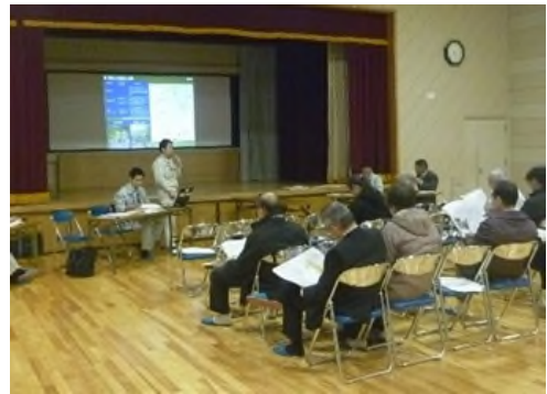
宅地防災勉強会イメージ