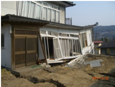
大規模盛土造成地の地震被害例