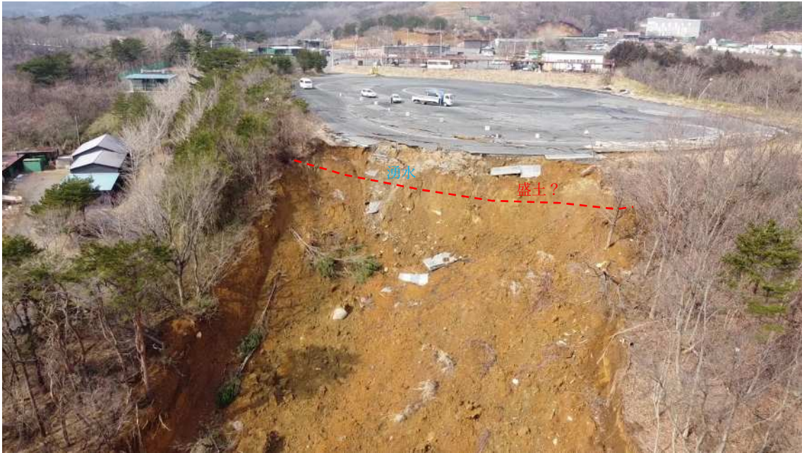
UAV による源頭部の状況