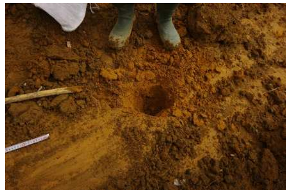
現地で確認されたローム層で確認されたスリッケンサイドとスリッケンライン