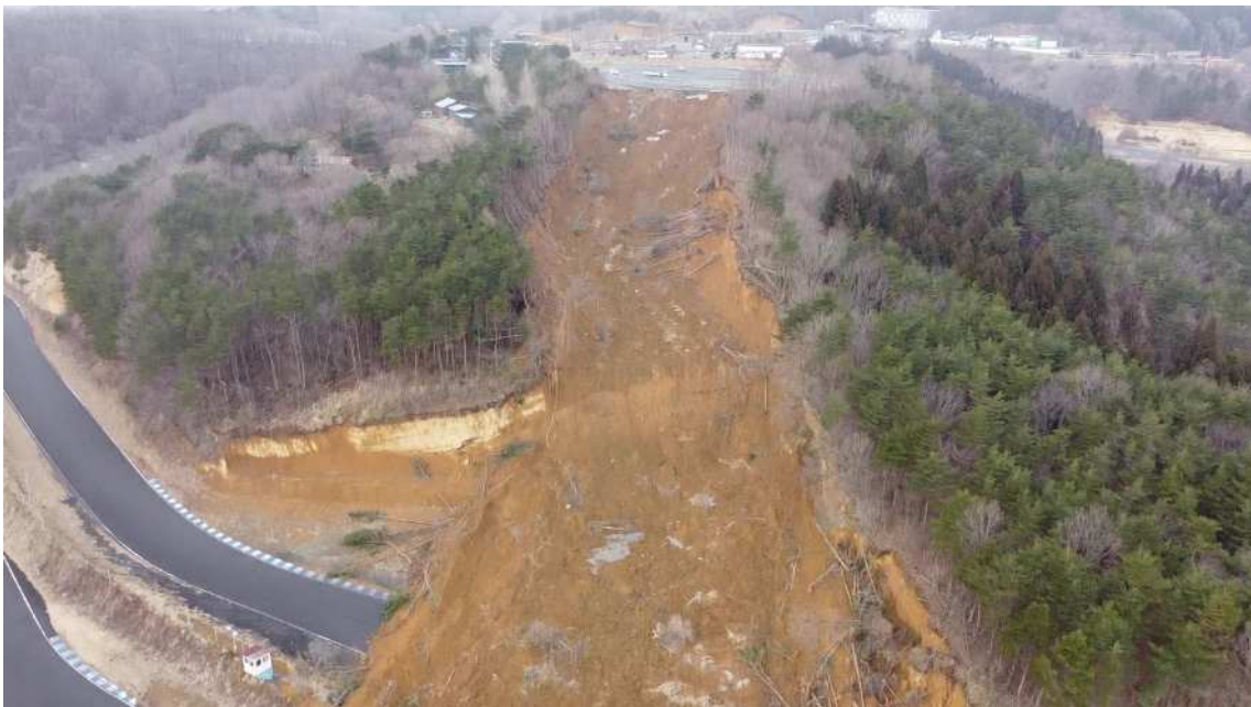
UAV による崩壊斜面全景