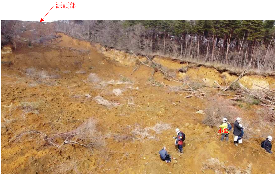
崩壊土砂の堆積箇所から源頭部を望む (UAV)