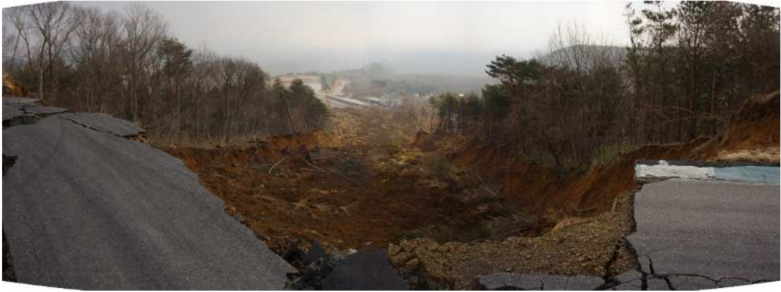
源頭部から崩壊土砂末端部を望む