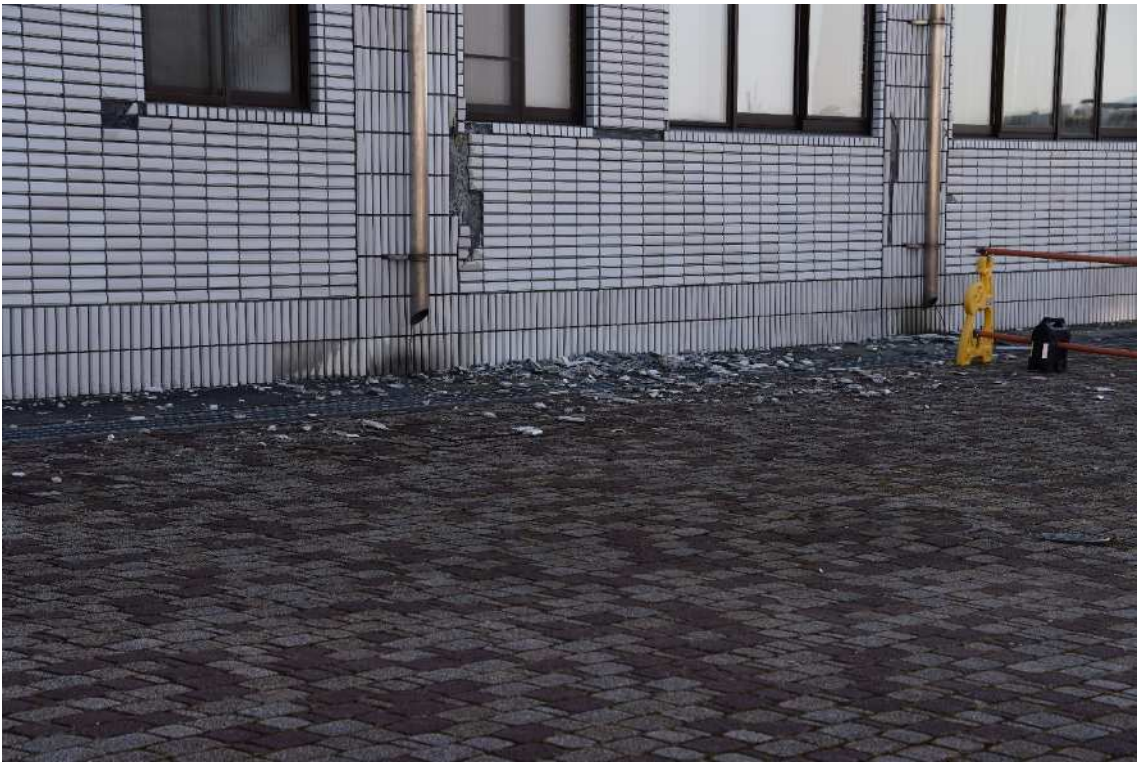
郡山市水道局の被害状況