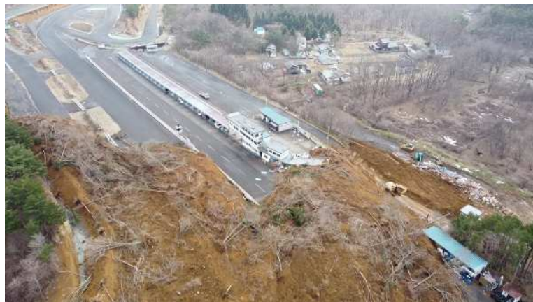
崩壊土砂流下末端部の状況 1 (UAV)