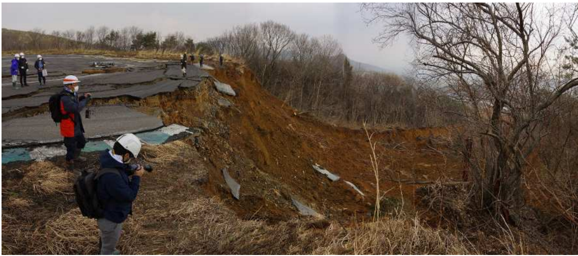
源頭部右側より滑落崖を望む