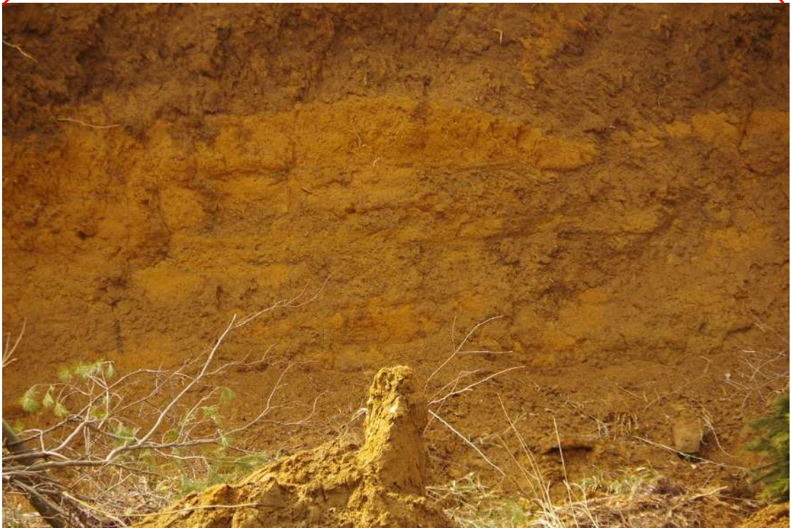
源頭部左側より右側側方せん断崖を望む