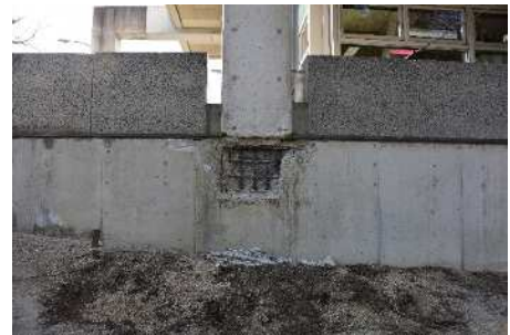
郡山中央図書館の被害状況（現在は休館になっている）