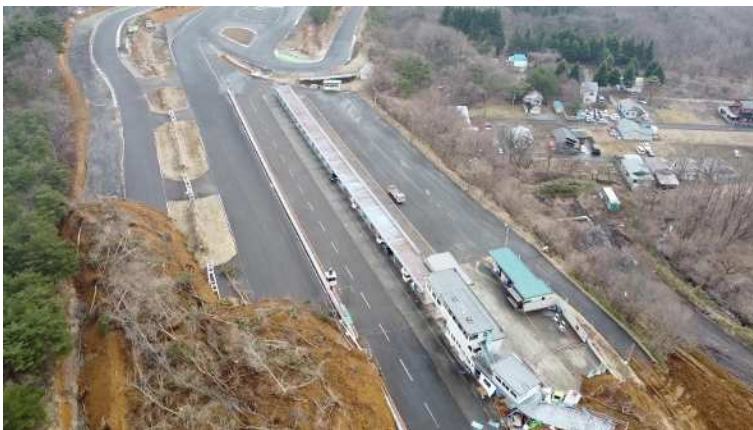
崩壊土砂流下末端部の状況 2 (UAV)