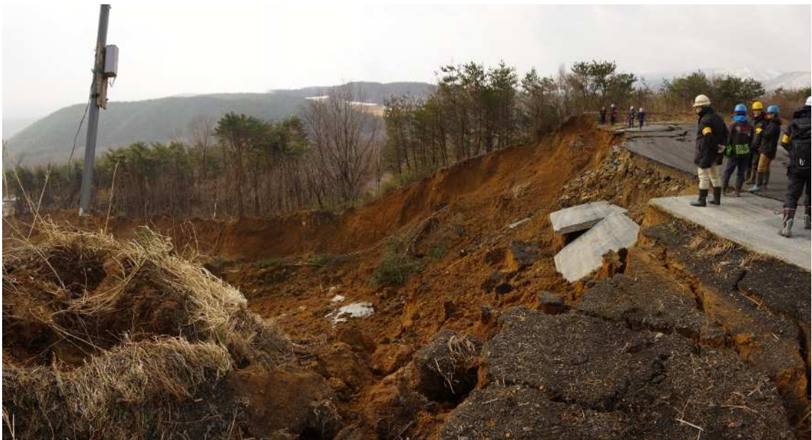
源頭部左側より滑落崖を望む